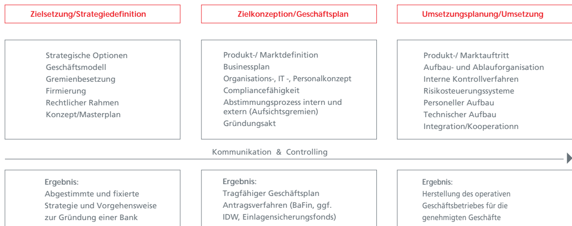
Vorgehensmodell zur Gründung einer Bank