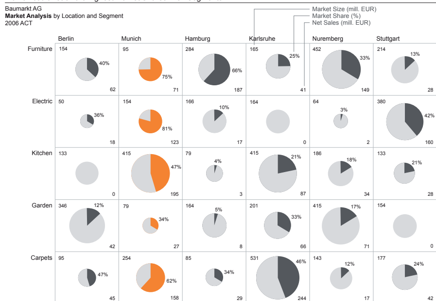
Munich could reach the highest Market Shares in all Segments

Beispiel einer Berichtseite mit hoher Informationsdichte und guter Vergleichbarkeit